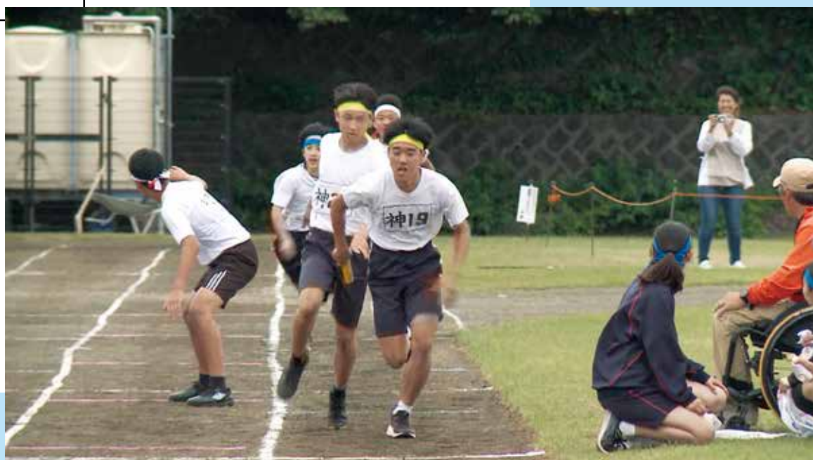
中学校 四島体育大会

編集・発行 ■ 東京都神津島村 情報通信課 〒100-0601 東京都神津島村904番地 ☎04992 (8) 0011 / fax 04992 (8) 1242