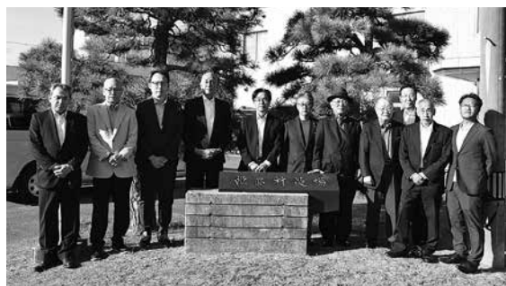
大分県姫島村 村役場

令和7年度議員自主研修及び友好親善都市 奥多摩町交流事業の報告をさせていただきます。議員自主研修の前日、10月20日、友好交流協定を結んでいる奥多摩町に行ってまいりました。奥多摩町長に表敬訪問し、奥多摩町議会議長、副議長、事務局2名に対応していただき、懇談や議場の見学を行いました。