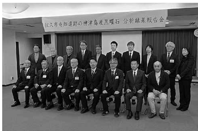
生きがい健康センター

翌日18日（日）には、生きがい健康センターで、佐久市寺畑遺跡で発掘された石器（神津島産黒曜石）の分析結果報告会が開催され、多くの方が来場し、黒曜石分析結果の講演や石器づくりの実演を体験しました。