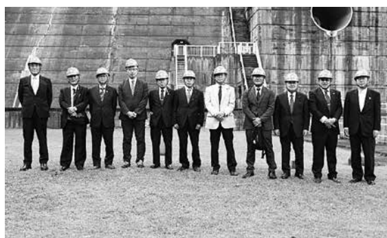
奥多摩町 小河内ダム