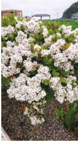
初夏を告げるシャリンバイ 撮影場所：まっチャールセンター広場