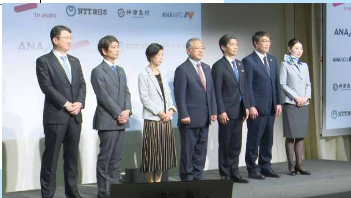
サステナブル観光ループ・神津島モデル新事業発表会

編集・発行 ■ 東京都神津島村 情報通信課 〒100-0601 東京都神津島村904番地 ☎04992 (8) 0011 / fax 04992 (8) 1242