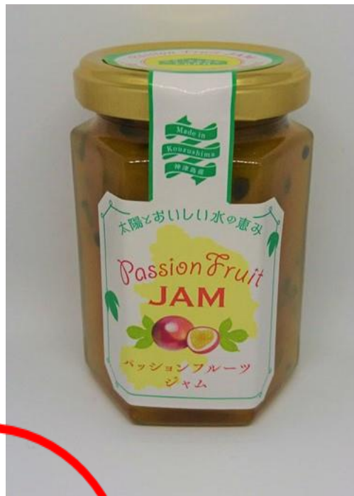
パッションジャム (種入り)