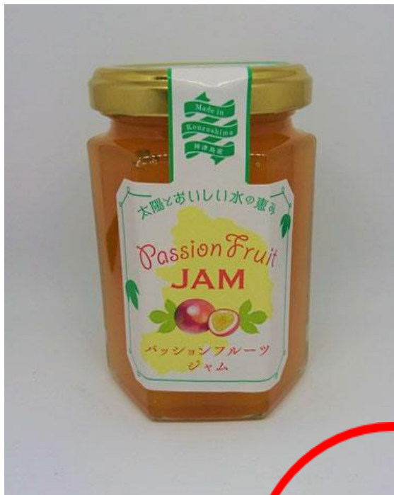
パッションジャム (種なし)