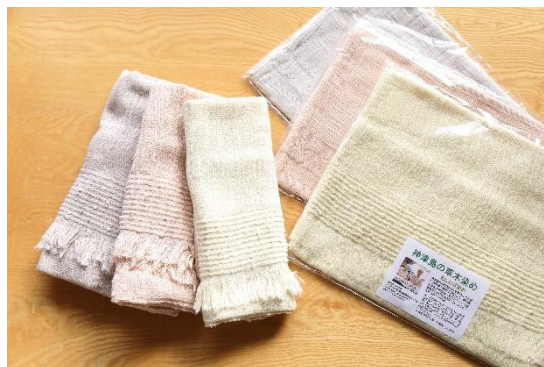
黄色 (あしたば染め) 茶・ピンク (ラセイタ染め)