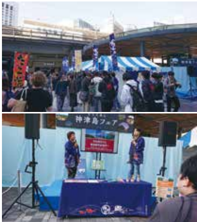
11月2〜3日開催の神津島フェア （物産購入に長蛇の列） 撮影場所：有楽町広場

牛肉祭り・サンマ祭り等々、開催されている中、神津島村も港区民祭りや奥多摩ふれあい祭り・多摩130周年たまらん博（立川駅）・有楽町神津島村フェア・佐久市農業祭などに、明日葉や赤イカ入塩辛・キンメダイ干物などの海産物を持って参加し、神津島の農海産物及び天上山や星空保護区の神津島等、物産PRや観光PRを実施しました。 一日も早く、神津島はもろろんのと全国各地がコロナ禍以前にも増して、活気が戻ってくるようお願い、ひたすら待ち望んでいます。