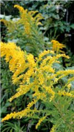
鮮やかな黄色のセイタカアワダチソウ(見た目は綺麗 だが、その繁殖力の強さから県内は要注意外来生物と して指定している)。 撮影場所：都道空港周辺

なお詳細は、神津CATV文字放送 などでご案内しておりますので、ご確 認下さい。