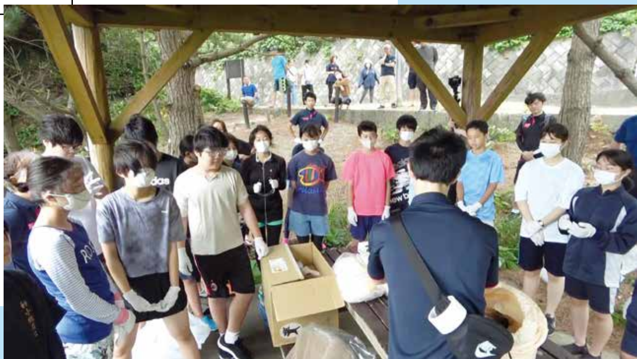
親子ふれあい海浜教室

編集・発行 ■ 東京都神津島村 情報通信課 〒100-0601 東京都神津島村904番地 ☎04992 (8) 0011 / fax 04992 (8) 1242