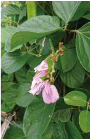
ハマナタマメの花と実 撮影場所：赤崎海岸

主役である子供達・そして保護者の 皆様・更に地域の皆様、将来の神津島 を背負っていく子供達の育成と地域の 賑わいを取り戻すため、皆様のご理解・ ご協力宜しくお願い致します。