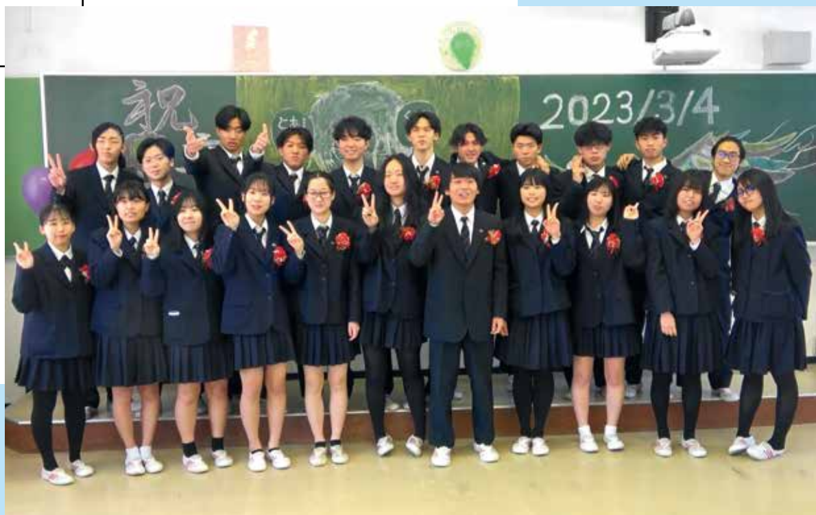
神津高等学校第49回卒業式

編集・発行 ■ 東京都神津島村 情報通信課 〒100-0601 東京都神津島村904番地 ☎04992 (8) 0011 / fax 04992 (8) 1242