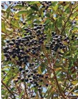
一見美味しそうな「イボタノキの実」アカハラやヒヨドリなど小鳥の餌になります。撮影場所：ヘリポート周辺

を目的とした「仮称」神津島ファームの整備工事が進められます。漁業振興関係では、引き続き「つきいそ事業」や離島再生支援事業継続の他、新規に「角氷製造用冷凍機改修」の予算を計上しました。観光振興関係では、通年観光を目標して星空保護区をはじめとした、様々な事業の継続の他、宿泊施設等改修整備に係る予算を計上しました。③子育てや福祉関係事業では、結婚祝金の増額や出産祝金制度を新規に創設しました。また、保育園・小・中・高校生の給食費全額補助も新規スタートしました。老人介護施設関係では、やすらぎの里職員住宅新築整備に係る予算を計上しました。 上記の他にも道路整備や住宅の整備促進はもとより、老人・障害者・児童福祉の充実、保健・医療関係の推進、教育関連施策の充実等、継続した事業実施に向けて取り組んで参ります。今後とも村民皆様のご理解とご協力を宜しくお願い致します。