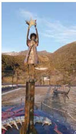
よたね広場に設置された星空保護区モニユメント

の時間の中で、神津島の星空の美しさ・素晴らしさを再認識すると共に、神津島の観光活性化に繋がらないかと取り組み、昨年十二月、認定一周年を迎える中でスターナイトフェスティバルと称して発表会を開催。星空保護を通じて自然保護や環境保全、光害やエネルギーの浪費など多くのことを学び、発表してくれました。夜間の開催にも拘わらず大勢の地域の皆様が参加し大盛況となりました。六年生の皆さん一年間頑張りましたね。お疲れ様でした。そしてありがとうございます。