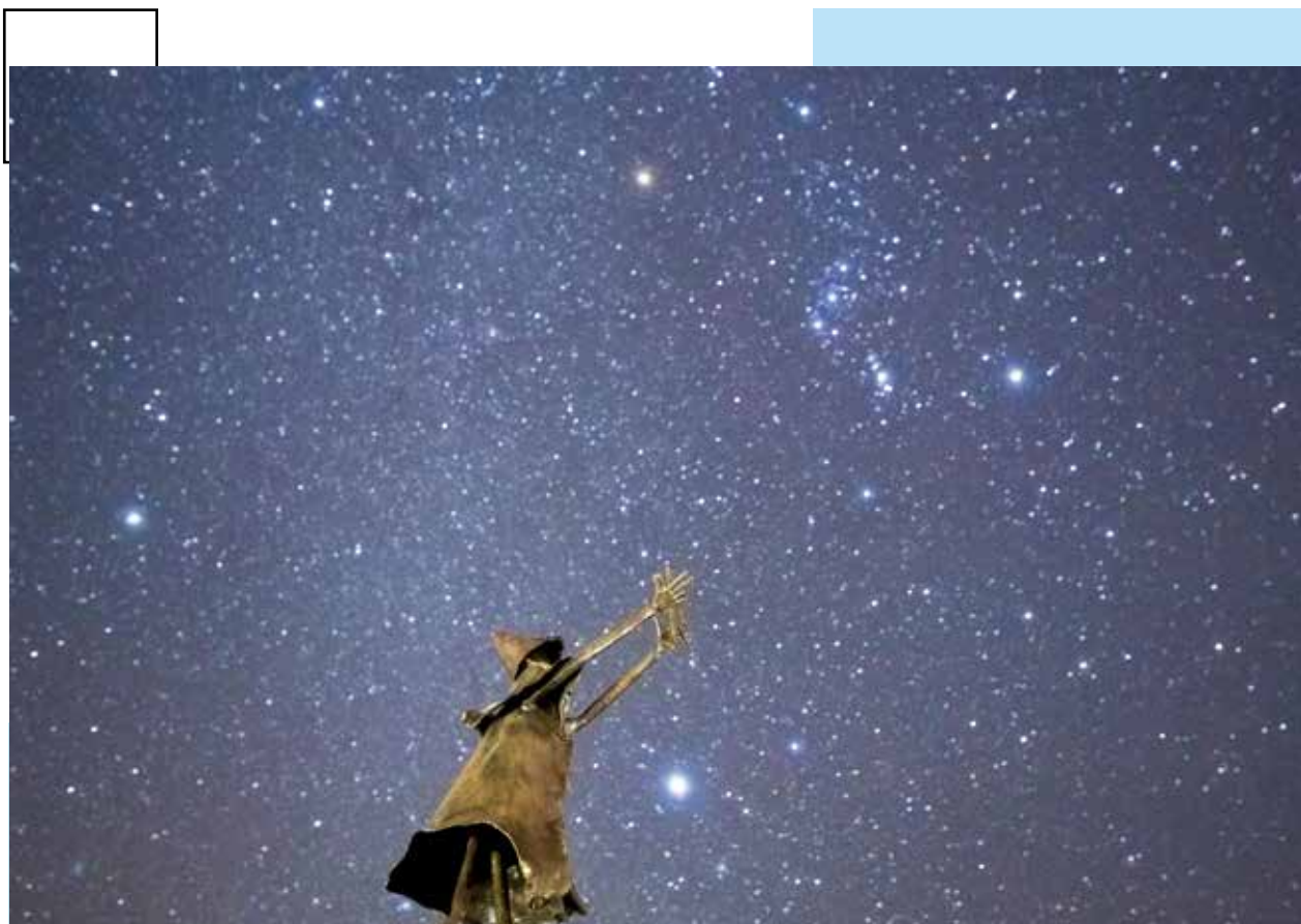
星空保護区モニュメント

編集・発行 ■ 東京都神津島村 情報通信課 〒100-0601 東京都神津島村904番地 ☎04992 (8) 0011 / fax 04992 (8) 1242