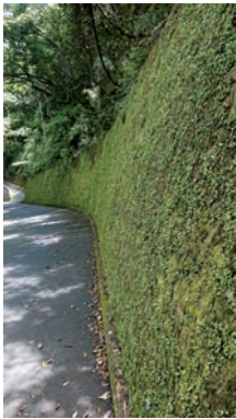
緑のカーテン (農道半坂線)

その様な中で8月中の観光来島者数 は、約4,900人で昨年の44%となっ ています。それぞれの遊泳場にライフ ガードの配置が出来ないなか、安全の 確保が心配されましたが、大きな事故 等もなく何とか乗り切れたことに安堵 してします。