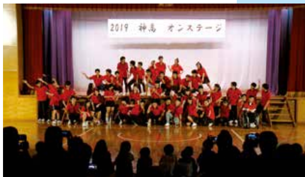
第48回 黒潮祭～神高オンステージ/高校生ダンス～