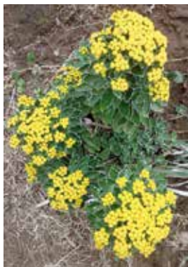
10月3日「村長と登る天上山ハイキングツアー」ガイド役として登りました。天上山のインギクです。

また、平成30年7月豪雨では、西日本を中心として中部地方や北海道地方を含む全国的に広い範囲で記録的な大雨となり、多数の人的被害の他、水道や通信等ライフライン、住宅や公共建物に甚大な被害が発生。この際に59万人の住民に避難勧告が発令されたが、実際に避難した人は1%程度だった。大規模災害が発生した場合行政だけの対応は困難。『自分の命は自分で守る』を常日頃より念頭において、早めの避難行動をとることが肝心。」と述べられており、改めて、住民皆様一人一人の防災意識の高揚を図ることが大事であると痛感したところです。