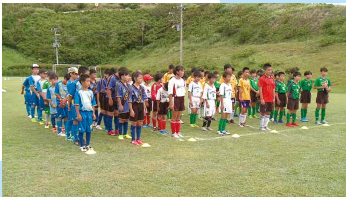
第6回ファイブアイランドリーグ+1 開会式