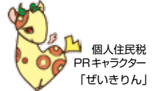
個人住民税 PRキャラクター 「ぜいきりん」

～10月の税目～ 納期限 10月31日(木) 税目 住民税 第3期 国民健康保険税 第5期