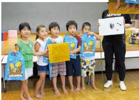
スヌーピーグループ