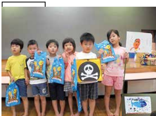
しんちゃんグループ

編集・発行 ■ 東京都神津島村 情報通信課 〒100-0601 東京都神津島村904番地 ☎04992 (8) 0011 / fax 04992 (8) 1242