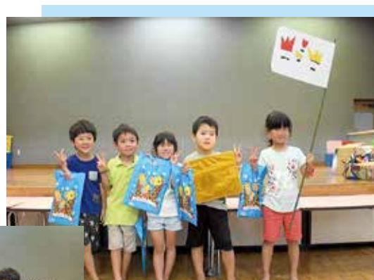
チューリップグループ