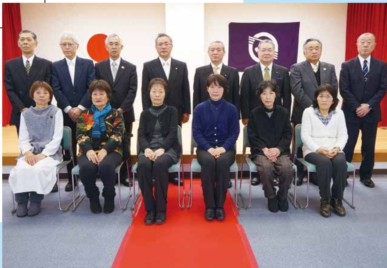
平成30年度 神津島村表彰式

編集・発行 ■ 東京都神津島村 情報通信室 〒100-0601 東京都神津島村904番地 ☎04992 (8) 0011 / fax 04992 (8) 1242