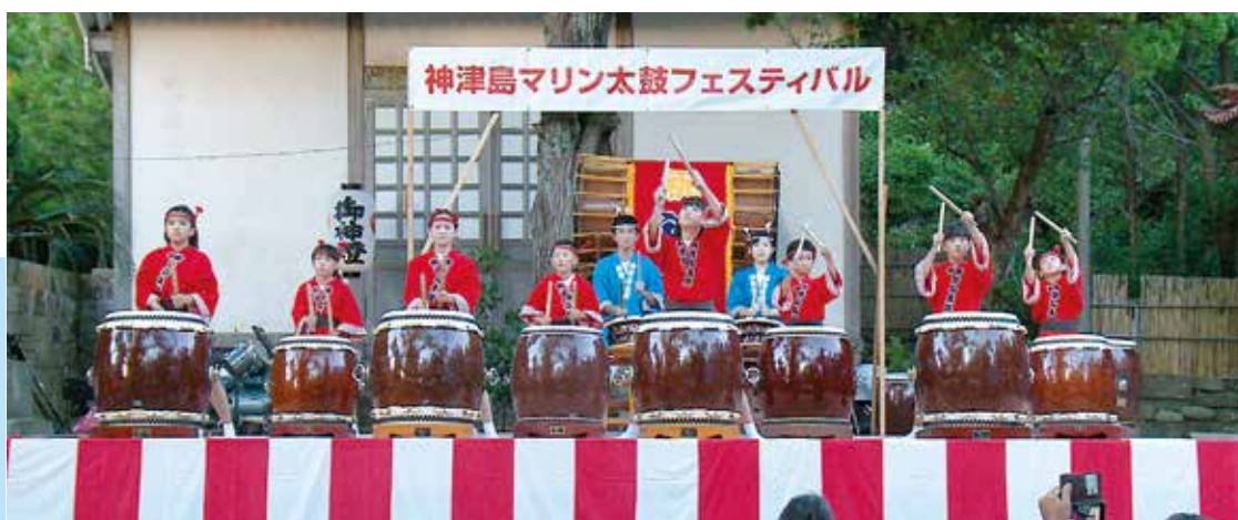
第23回マリン太鼓フェスティバル