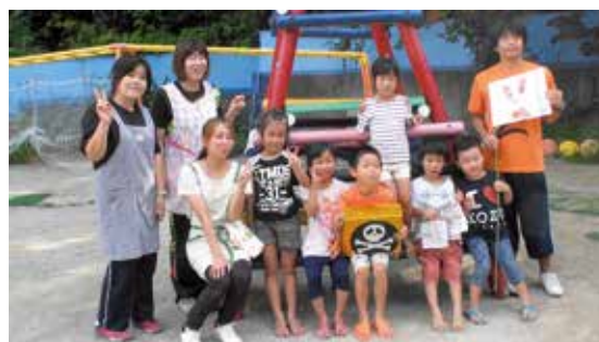
「保育園お泊まり会」