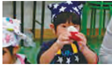
昨年はイチゴ大福に挑戦しました

何にでも興味をもつ年齢です。食べること、何かをつくること、親子、お友だちと一緒に食の体験をしてみませんか?