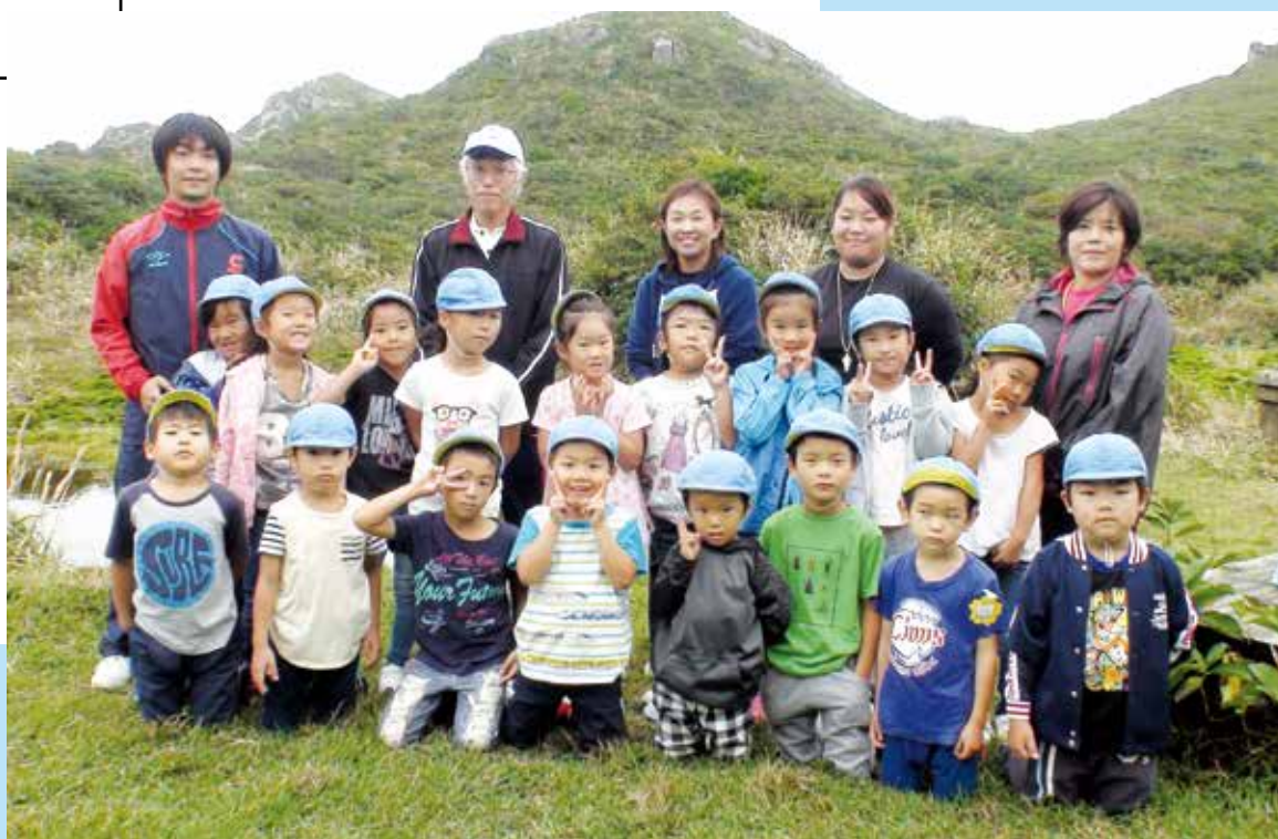
「保育園ほし組 天上山登山」

編集・発行 ■ 東京都神津島村役場総務課 〒100-0601 東京都神津島村904番地 ☎04992 (8) 0011 / fax 04992 (8) 1242