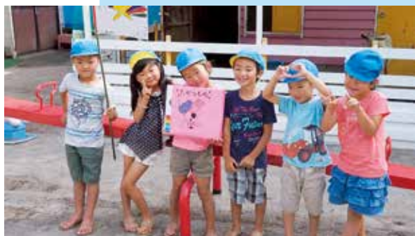
「ながれぼしグループ」