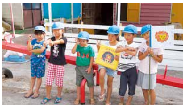
「ライオングループ」