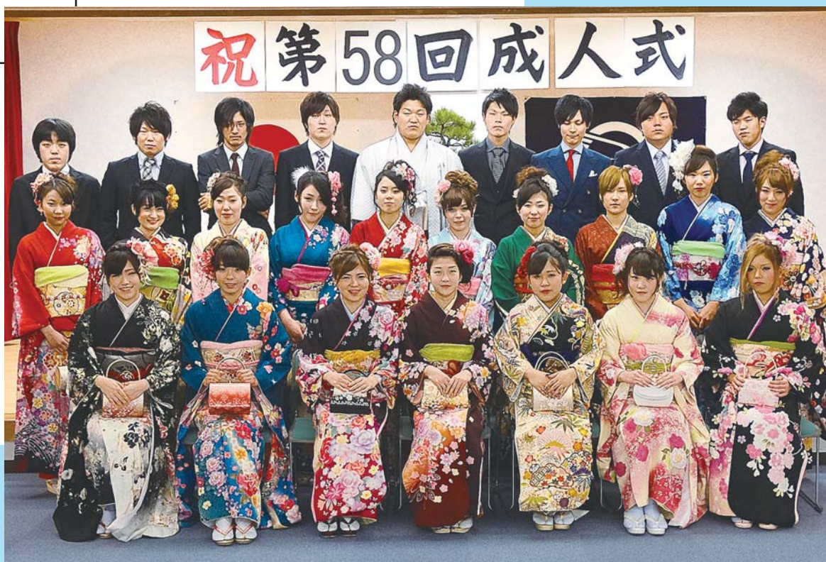
「平成26年 第58回成人式」

編集・発行 ■ 東京都神津島村役場総務課 〒100-0601 東京都神津島村904番地 ☎04992 (8) 0011 / fax 04992 (8) 1242