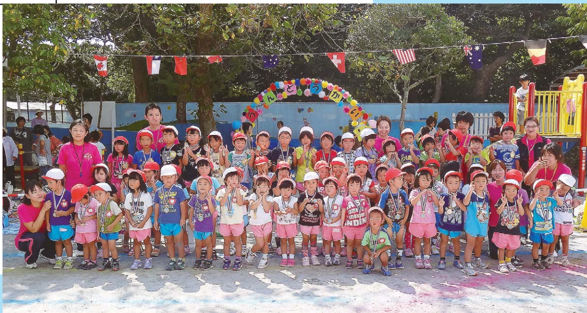
「はまゆう保育園 親子運動会」

編集・発行 ■ 東京都神津島村役場総務課 〒100-0601 東京都神津島村904番地 ☎04992 (8) 0011 / fax 04992 (8) 1242