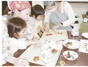
人参の型抜きに挑戦!

ご飯ケーキは、卵そぼろ、ひき肉のそぼろ、人参、ほうれん草などで楽しく飾り付けされました。苦手な野菜にも挑戦できました。