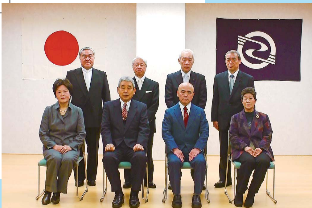
「平成23年度 神津島村表彰式」

編集・発行 ■ 東京都神津島村役場総務課 〒100-0601 東京都神津島村904番地 ☎04992 (8) 0011 / fax 04992 (8) 1242