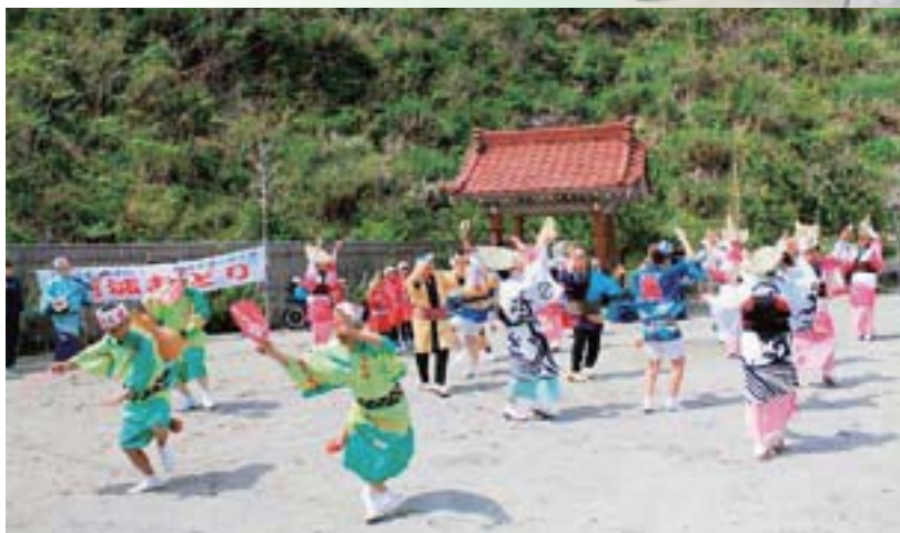
日除け雨除け施設（龍神ロード） 完成式典の様子