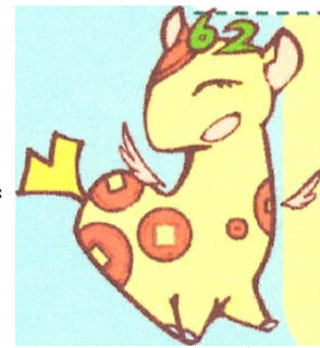
個人住民税PRキャラクター「ぜいきりん」

個人住民税は、前年の所得に応じて課税される「所得割」、定額で課税される「均等割」からなっています。