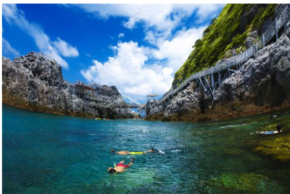
【神津島村 赤崎遊歩道】

東京都神津島村は、スキューバダイビングやトレッキングなどの観光が盛んで、2020年12月には島全体が星空保護区※に認定され、天体観望でも注目されている伊豆諸島の島です。