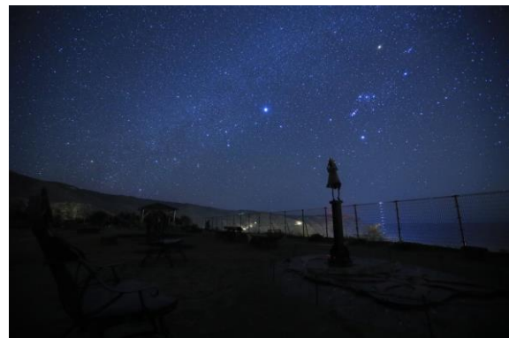
【神津島村 よたね広場の星空】