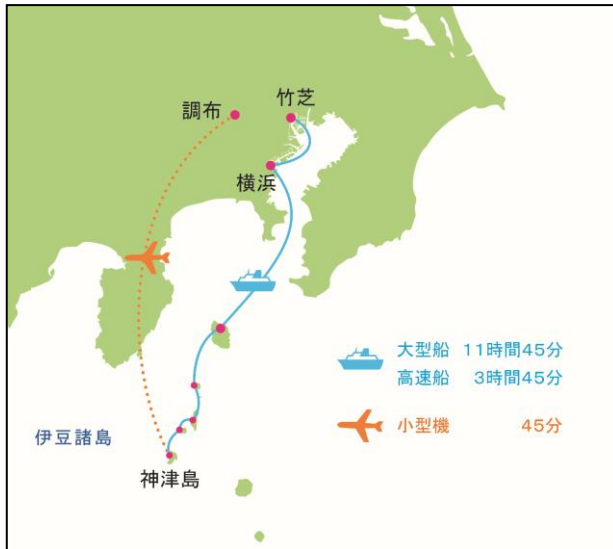
【東京都神津島村へのアクセス】