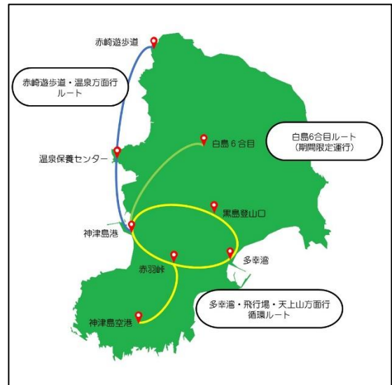
【神津島地図と村営バスルート】

東京都神津島村は、スキューバダイビングやトレッキングなどの観光が盛んで、2020年12月には島全体が星空保護区※に認定され、天体観望でも注目されている伊豆諸島の島です。